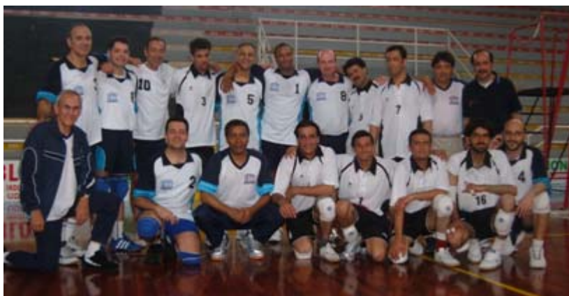
د ملګرو ملتونو د افغانستان والیبال ټیم

د ملګرو ملتونو د افغانستان د والیبال ډلې د ملګرو ملتونو په هغو لوبو کې د ژيرو (برونز) تمغه وګټله چې د مې له ۱۷-۲۳ پورې د ایټالیا د پیسارو په ښار کې ترسره شوې. په دغو لوبو کې د ملګرو ملتونو ۱،۳۵۰ کارکوونکو برخه اخیستې وه. په افغانستان کې د ملګرو ملتونو له سازمانونو څخه څلورویشت لوبغاړو د فوټبال، باسکېټبال، لامبو، ټیبل ټینس او والیبال په لوبو کې برخه اخیستې وه.