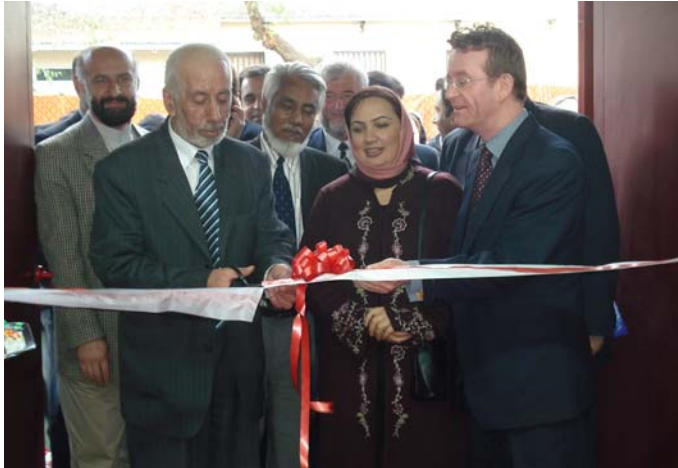
ښاغلی ستانیکزی او ښاغلی هالند د مرکز د پرانیستلو د مراسمو په ترڅ کې پټه پری کوي

پرانستې په مراسمو کې د خپلو خبرو په ترڅ کې وویل: "دا هېواد یو داسې پرمختیایي لرلید ته اړتیا لري چې د افغانانو