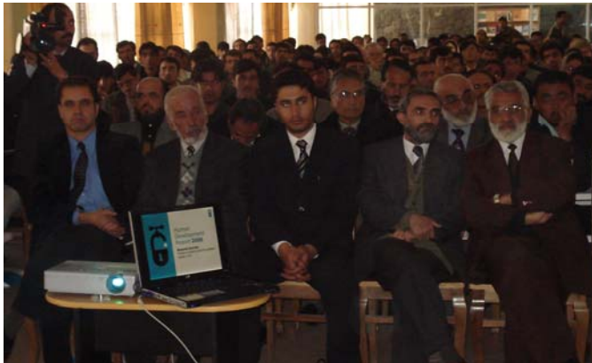
Over 200 academics, students, Gov officials and other experts participated in the Report's launching

چې د ده په خبره د ځمکې لاندې اوبو د تر اندازې ډیر استعمال له امله د ځمکې لاندې اوبو کچه په تدریجي ډول کمه شوې او د راتلونکو لسيزو لپاره ستره ننگونه رامنځته