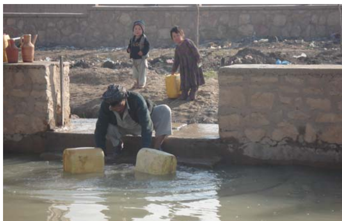
د ایبکو ښار اوسېدونکي له ویالو او ښو نه اوبه اخلي

لښتنيو او یو څو ډنډونو اوبه څښي. دغه ناپکې اوبه د ښار اوسېدونکي له سترو روغتیايي ستونزو سره مخ کوي. د دې ستونزې برسېره، په اورې (دوبې) کې د لښتنيو او ډنډونو اوبه وچیري او د خلکو ژوند لا ډیر ستونزمنوي. په اورې کې د اوبو له وچېدو سره ښځې او