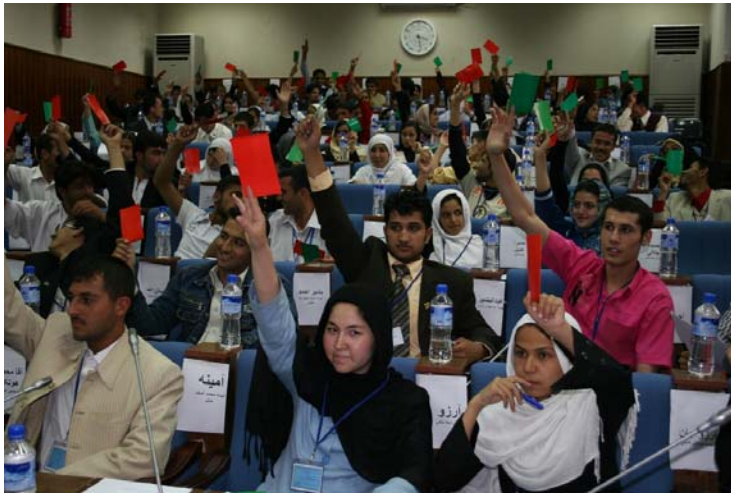
په کابل کې د ځوانانو روزنیز پارلمان @ د ملگرو ملتونو پرمختیایي اداره

اړتیاوې یې څه دي ځوابونه یې توپیر هغه ډول چې د دوی عمرونه، تیر حال او جنس توپیر لري. د تیر اګست په میاشت کې له ۳۴ ولایتونو نه تر ۳۰۰ ډیر ځوانان سره پر دې ټکي د خبرو اترو لپاره سره راټول شول